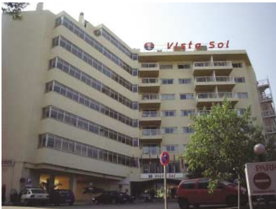
Hotell Vista Sol sett från framsidan!